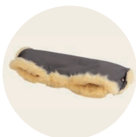
Erdmännchen Art. Nr. 937