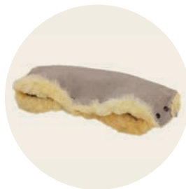
Sand Art. Nr. 951