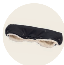
Panther Art. Nr. 9422