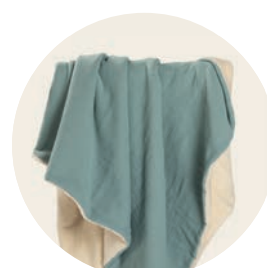
Mint Art. Nr. 9900