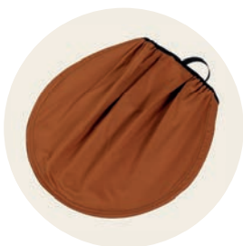
Terracotta Art. Nr. 97050