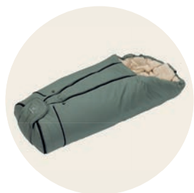
Jade Art. Nr. 8552