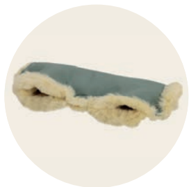
Jade Art. Nr. 952