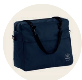
Kornblume Art. Nr. 9517