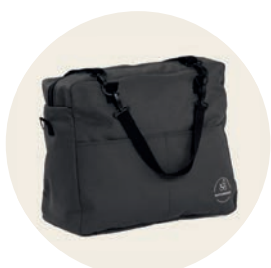
Erdmännchen Art. Nr. 9545