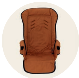
Terracotta Art. Nr. 98050