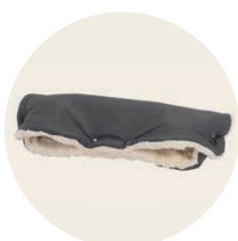
Erdmännchen Art. Nr. 9445