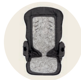
Flughörnchen Art. Nr. 98049