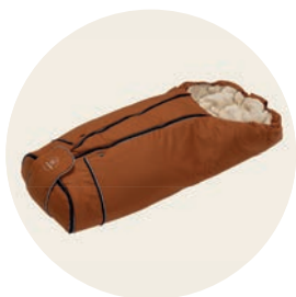
Terracotta Art. Nr. 8550