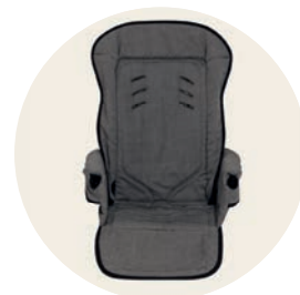
Tulum Art. Nr. 98053