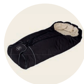
Panther Art. Nr. 8522