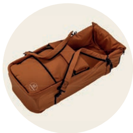
Terracotta Art. Nr. 6050