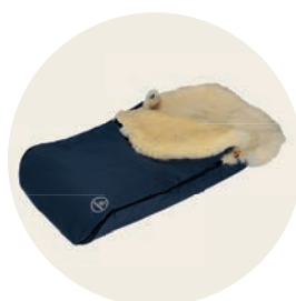
Kornblume Art. Nr. 91415