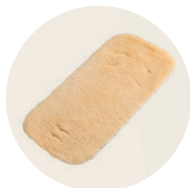
Lammfell für Tragenest und Babykorb / Lambskin for soft carrycot and hard carrycot – Art. Nr. 913 Lammfell für Babykorb XL und Max / Lambskin for hard carrycot XL and Max – Art. Nr. 914