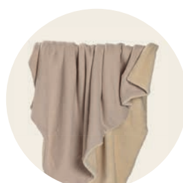
Puder Art. Nr. 9901