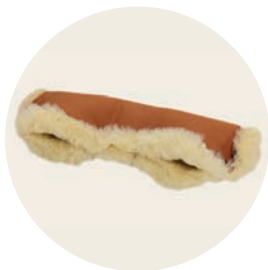
Terracotta Art. Nr. 950