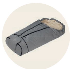
Siebenschläfer Art. Nr. 8540 Cotton Art. Nr. 8640