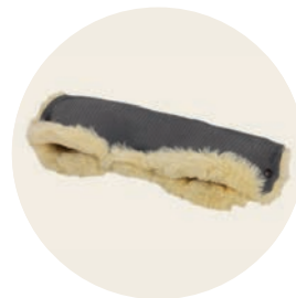
Tulum Art. Nr. 953