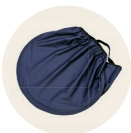
Kornblume Art. Nr. 97015