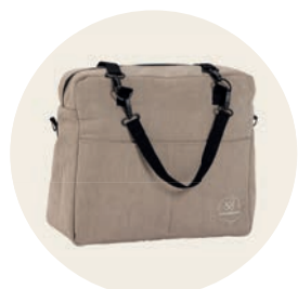
Sand Art. Nr. 9551