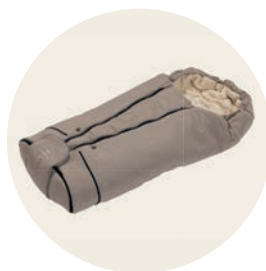
Sand Art. Nr. 8551