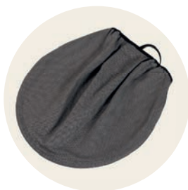
Tulum Art. Nr. 97053