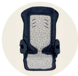
Iris Art. Nr. 98047