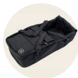
Panther Art. Nr. 6022