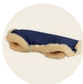
Kornblume Art. Nr. 939