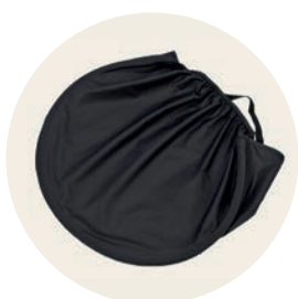
Panther Art. Nr. 97002