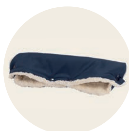
Kornblume Art. Nr. 9417