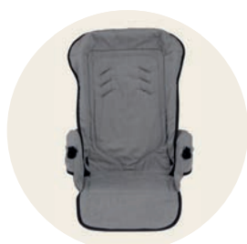
Siebenschläfer Art. Nr. 98040