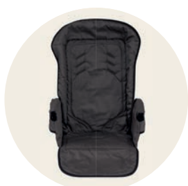
Erdmännchen Art. Nr. 98045