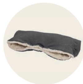
Tulum Art. Nr. 9453