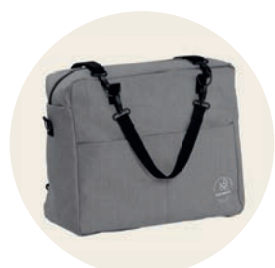
Siebenschläfer Art. Nr. 9540