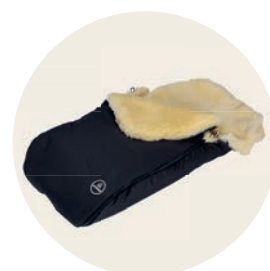
Panther Art. Nr. 91402