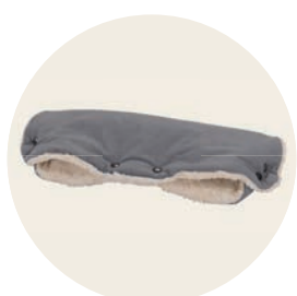
Siebenschläfer Art. Nr. 9440