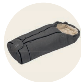
Tulum Art. Nr. 8553