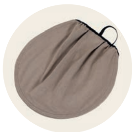
Sand Art. Nr. 97051