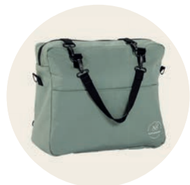
Jade Art. Nr. 9552