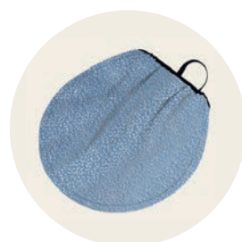
Vergissmeinnicht Art. Nr. 97054