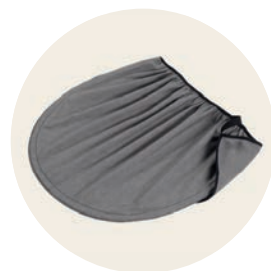
Siebenschläfer Art. Nr. 97043