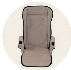
Sand Art. Nr. 98051