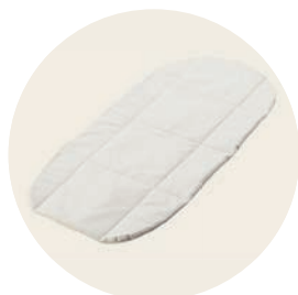
Baumwoll-Einlage / Organic cotton insert – Art. Nr. 912 Baumwoll-Einlage für Babykorb XL und Max / Organic cotton insert for hard carrycot XL and Max – Art. Nr. 907