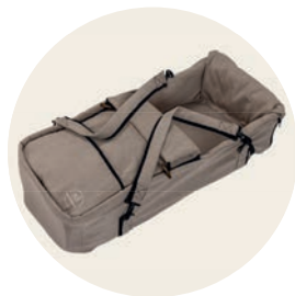
Sand Art. Nr. 6051