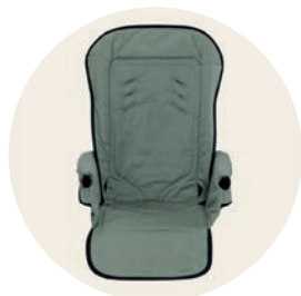
Jade Art. Nr. 98052