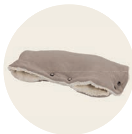
Sand Art. Nr. 9451