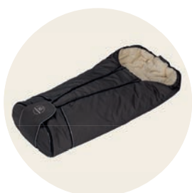
Erdmännchen Art. Nr. 8545