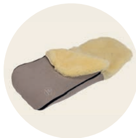
Sand Art. Nr. 91451