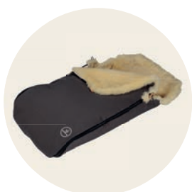
Erdmännchen Art. Nr. 91444