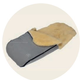
Siebenschläfer Art. Nr. 91443