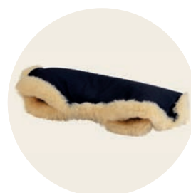
Panther Art. Nr. 942