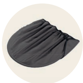
Erdmännchen Art. Nr. 97044