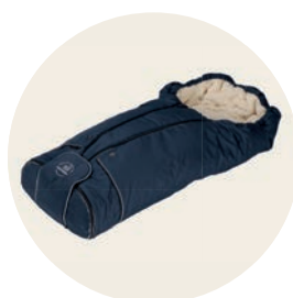
Kornblume Art. Nr. 8517