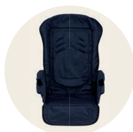
Kornblume Art. Nr. 98017