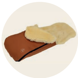
Terracotta Art. Nr. 91450