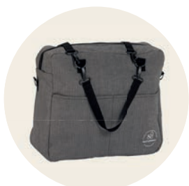
Tulum Art. Nr. 9553