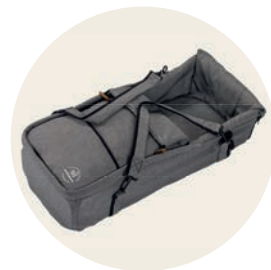
Tulum Art. Nr. 6053