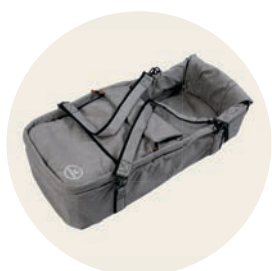
Siebenschläfer Art. Nr. 6040 Cotton Art. Nr. 6140