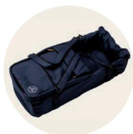
Kornblume Art. Nr. 6017