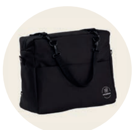
Panther Art. Nr. 9522