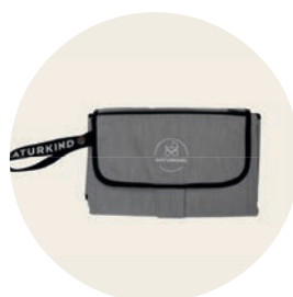
Clutch Siebenschläfer Art. Nr. 9640