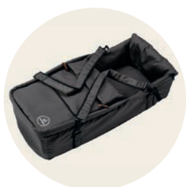
Erdmännchen Art. Nr. 6045