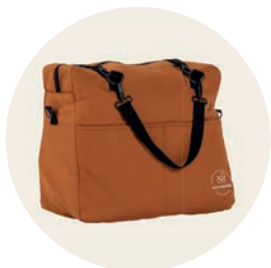
Terracotta Art. Nr. 9550