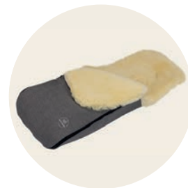
Tulum Art. Nr. 91453