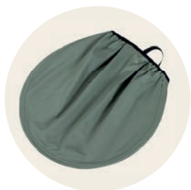
Jade Art. Nr. 97052