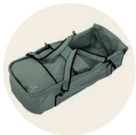
Jade Art. Nr. 6052