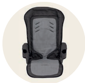
Waschbär Art. Nr. 98042