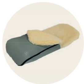
Jade Art. Nr. 91452