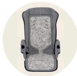
Schnee-Eule Art. Nr. 98048