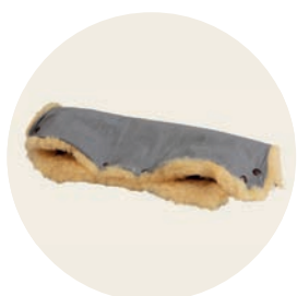
Siebenschläfer Art. Nr. 936