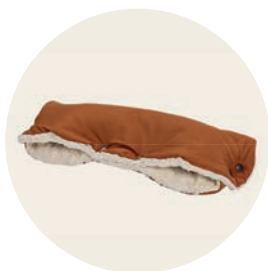
Terracotta Art. Nr. 9450