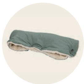
Jade Art. Nr. 9452