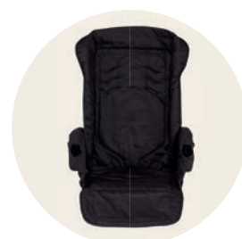
Panther Art. Nr. 98022