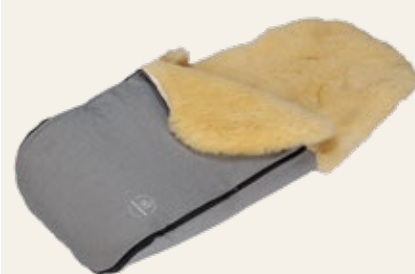
grau meliert / mottled grey Art. Nr. 91443