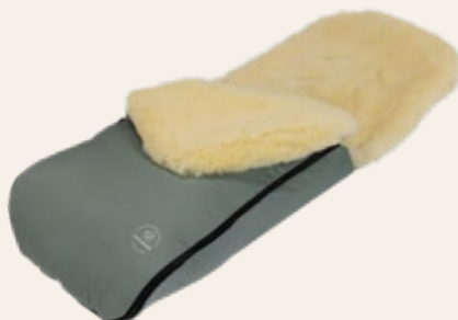
Jade / jade Art. Nr. 91452