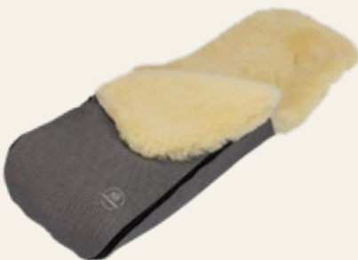
schwarz-weiß gemustert / black and white patterned Art. Nr. 91453