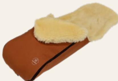
Terracotta / terracotta Art. Nr. 91450