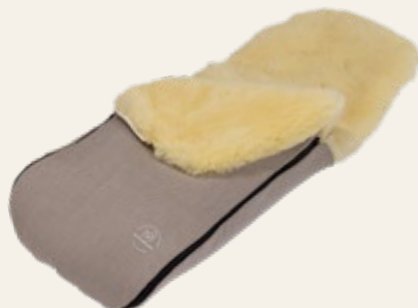
Sand / sand Art. Nr. 91451