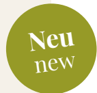
Bestellbar ab Jänner 2024 Can be ordered from January 2024