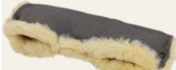
schwarz-weiß gemustert / black and white patterned Art. Nr. 953