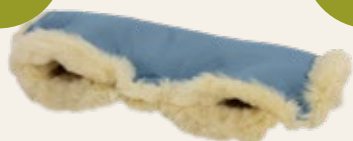
Topas / topas Art. Nr. 958