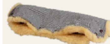
grau meliert / mottled grey Art. Nr. . 936