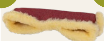
rot meliert - mottled red Art. Nr. 956