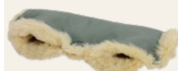
Jade / jade Art. Nr. 952