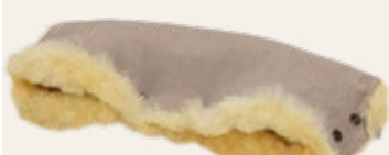
Sand / sand Art. Nr. 951