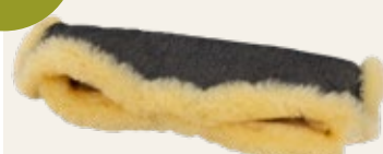
schwarz meliert / mottled black Art. Nr. 955