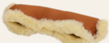
Terracotta / terracotta Art. Nr. 950