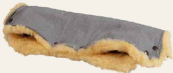
Art. Nr. 936 grau meliert / mottled grey