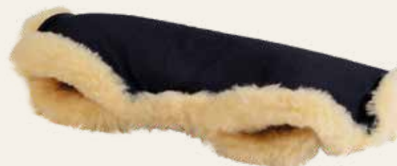
Art. Nr. 942 schwarz / black