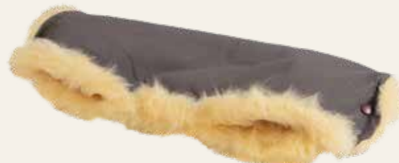
Art. Nr. 937 schiefergrau / slate grey