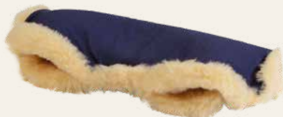
Art. Nr. 939 dunkelblau / dark blue