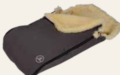
Art. Nr. 91444 schiefergrau / slate grey