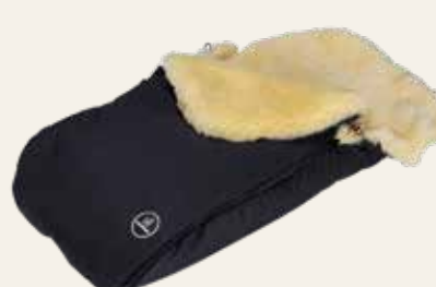
Art. Nr. 91402 schwarz / black