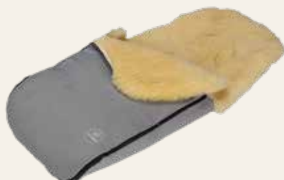
Art. Nr. 91443 grau meliert / mottled grey