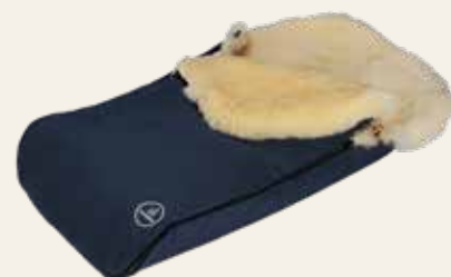
Art. Nr. 91415 dunkelblau / dark blue