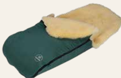
Art. Nr. 91436 salbei / sage